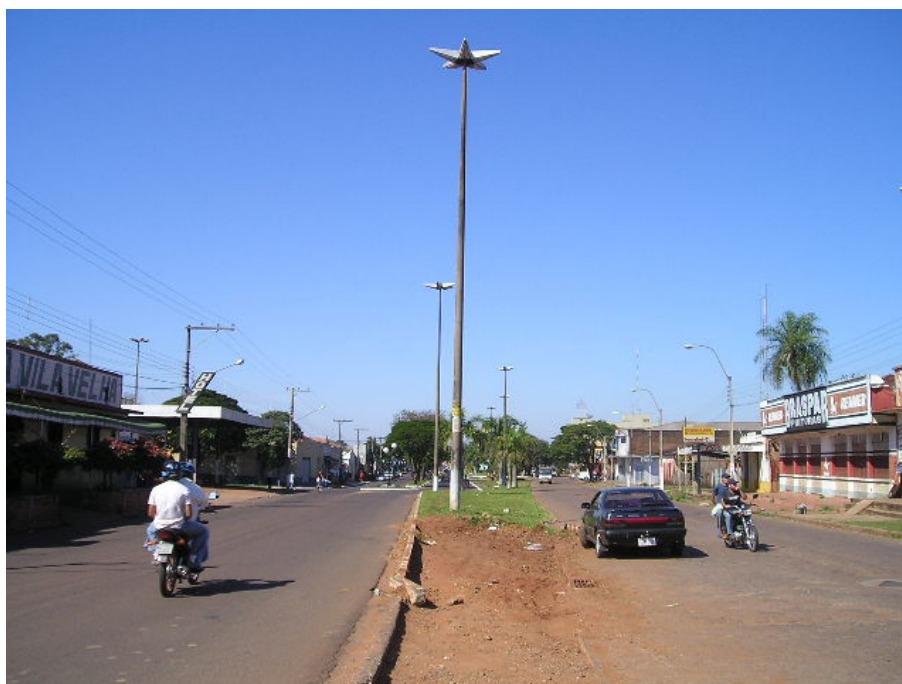
Figura 01: Linha de fronteira e a proximidade entre os territórios brasileiro e paraguaio

Os municípios são divididos por uma linha conhecida como linha de fronteira ou internacional, cuja extensão urbana é de aproximadamente 13 quilômetros. Essa linha é demarcada fisicamente: do lado brasileiro o limite é a Avenida Internacional e do lado paraguaio, Rua Dr. Francia.